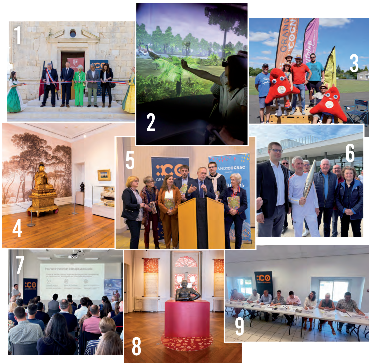
1 Inauguration du Château de Bouteville • 2 Inauguration de l'Expérience au milieu des dinosaures d'Angeac-Charente • 3 Journée Olympiades des centres de loisirs de Grand Cognac 4 Nouveau parcours - La Maison du Négociant Musée d'Art et d'Histoire • 5 Parcours éducatifs 2024 • 6 Passage de la flamme Olympique sur le territoire de Grand Cognac • 7 Petit déjeuner de l'éco • 8 Vernissage - Exposition François 1 er - La Maison du négociant - Musée d'art et d'histoire 9 Signature du contrat de ville 2024-2030.